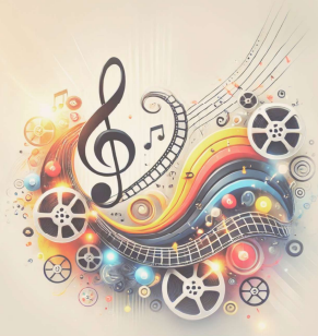
Table-ronde “Cinéma et Musique”