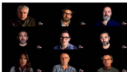
Photo illustrant la collection « C'est quoi être cinéaste aujourd'hui », entretiens consultables sur le site de l'ARP https://www.larp.fr/