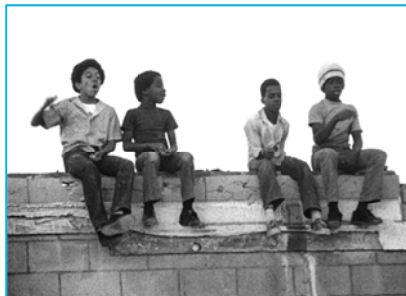
Killer of Sheep, Charles Burnett

(...) L'une des plus vastes rétrospectives consacrées à la « question Noire » jamais présentée en Europe.